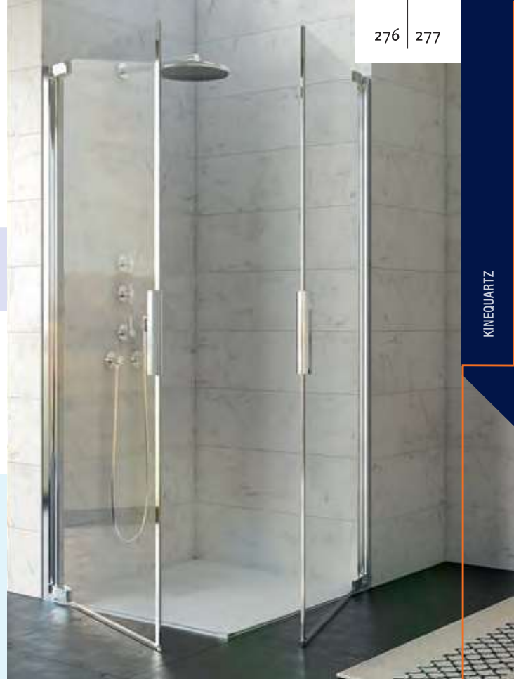
▲ KINEQUARTZ MET PROFIEL - A/P | PROFILÉ - A/P