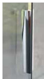
▲ Verchromde metalen handgreep ▷ Poignée métallique chromée

INFO ▶ Bij montage op een douchebak, ligt de vaste wand 2,2 cm naar binnen t.o.v. de douchebak. Bij montage op een tegelvloer dient u hiermee rekening te houden voor het te betegelen oppervlak, of u kunt kiezen voor maatwerk om de juiste maten te verkrijgen (zie p.280-281). ▶ Dans le cas d'une pose sur receveur, la largeur de la paroi intègre un retrait de 2,2 cm. Dans le cas d'une installation sans receveur, prendre en compte ce retrait pour déterminer la zone à carrelor ou opter pour des dimensions sur-mesure (voir p.280-281).